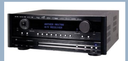
ATR audio Trade GmbH MRX 700