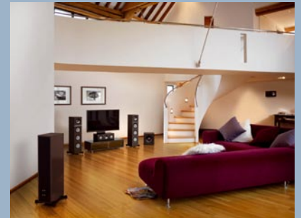
GP-Acoustics Q Series

Der Blu-ray-HD-Receiver K8 ist das neueste und komplexeste Produkt das T+A bisher entwickelt und produziert hat. Dieses Gerät ist die leistungsstarke Zentrale einer hochmodernen Heimkino-Surroundanlage, ausgestattet mit den besten heute zur Verfügung stehenden Technologien. Der K8 ist extrem flexibel einsetzbar; sowohl der anspruchsvolle Heimkinoliebhaber soll mit der 7.1-Ausstattung und der exzellenten Blu-ray-Wiedergabe auf seine Kosten kommen als auch jene, denen ein 5.1- oder 3.1-Setup ausreichen. Sogar für reine Zweikanalfreunde gibt es hochwertige Stereomodis. Durch die sieben Endstufen mit jeweils mehr als 150 Watt Dauerleistung können je nach Betriebsart bis zu drei Nebenräume mit unabhängiger Lautstärkeregelung in Stereo beschallt werden.