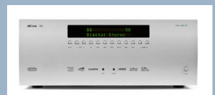
GP Acoustics Arcam AVR400